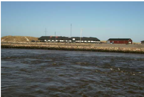
Strandingsmuseet i Thorsminde

I stedet for at fortsætte ligeud mod Bovbjerg og Ferring kan man - kort efter hvor Nissum fjord ender - drejes til højre over Bøvlingbjerg, gennem små landsbyer som Torp, Møborg og videre til Bur.