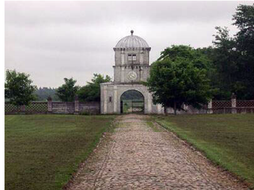
Portbygningen på Nørre Vosborg

7. Der kan herefter fortsættes frem til hovedvej 28, hvor der drejes til venstre mod Ulfborg. 500 m henne ad vejen på højre hånd er der mulighed for en afstikker til den gamle herregård Nørre Vosborg, som også H.C. Andersen besøgte. Her bydes på oplevelser uden- og indendørs på alle årstider og for alle aldersgrupper.