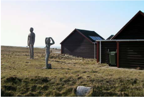
Jens Søndergård-museet i Ferring

5. Fortsæt herefter videre over Bonnet og Lomborg hvor man bliver ført gennem Klosterheden Plantage - et stort skovområde med hospitalsbunker, skovlegeplads og shelters.